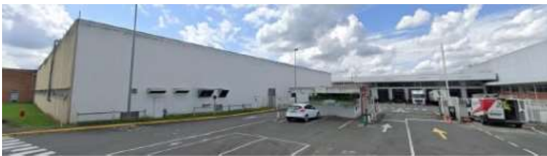
Vue de l'entrée routière du site de La Suze (72)